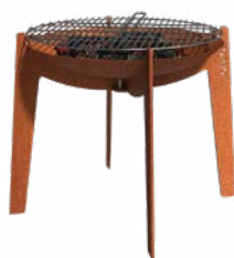
COSA + GRILL