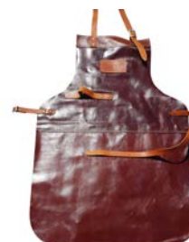
FORNO TABLIER EN CUIR