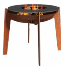
COSA + PLAQUE DE CUISSON