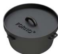
FORNO CASSEROLE EN FONTE