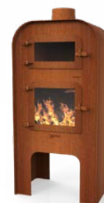
GAP + PIZZA