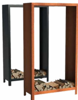
STOCKAGE DE BOIS

Pour un aperçu complet de tous les modèles et des options spécifiques au produit, visitez www.forno.nl