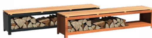
STOCKAGE AVEC SIÈGE