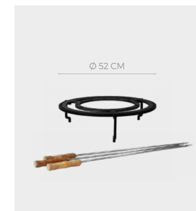
OFYR BRAZILIAN GRILL SET 100