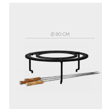
OFYR BRAZILIAN GRILL SET XL