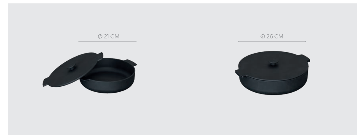
OFYR CAST IRON CASSEROLE 26